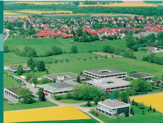
Max-Planck-Institut für Sonnensystemforschung