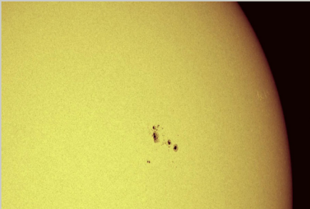
D Ein Maß für die Aktivität der Sonne ist die Anzahl der dunklen Flecken auf der Sonnenoberfläche. Diese Aufnahme stammt vom August 2011.

sind diese Gebiete besonders zahlreich. In Zeiten hoher Sonnenaktivität kommt es zudem zu besonders vielen und besonders heftigen Sonnenstürmen. Sonnenstürme – auch sehr starke – können jedoch vereinzelt auch im Aktivitätsminimum auftreten.